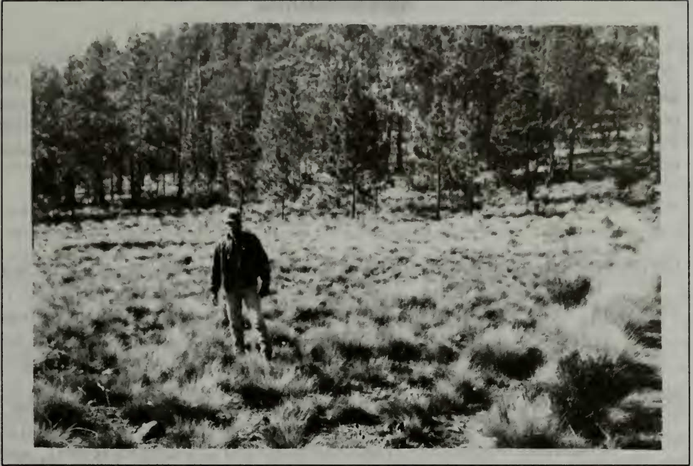
Fig. 4 La sabana de Danthonia domingensis en el Vallecito de Lilís, entre el Pico Duarte y Loma La Pelona. Los pinos en el fondo crecen sobre Loma La Pelona.

El pastoreo excesivo ejercido por estos animales, especialmente durante los meses secos del invierno, de diciembre a marzo, afecta las hierbas de la sabana y también a las plantas leñosas de los picos. Las plantas normalmente no son consumidas durante la estación de producción de forraje y sufren el pastoreo excesivo durante el tiempo seco, cuando el forraje fresco y más aceptable es escaso.